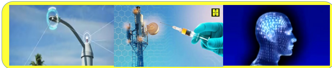
Le PLAN selon Gaius Baltar

Outre la graphénisation de nos corps, des aliments en liens avec l'inondation d'ondes électro-magnétiques puissantes dans tous les aspects de nos vies courantes... il faut aussi considérer ce qui suit: